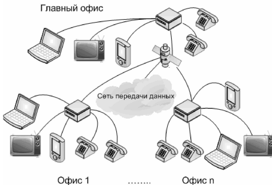
Рис. 1. Схематическое изображение МСС

Математический аппарат для рационального выбора пакета ТКУ, предоставляемых на основе МСТ. Мультисервисная сеть представляет собой универсальную многоцелевую среду, предназначенную для передачи речи, изображения и данных с использованием технологии коммутации пакетов (IP) (рис. 1).