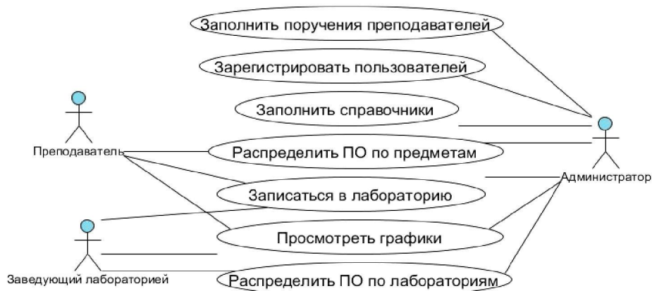
Рис. 1. Диаграмма вариантов использования

При концептуальном проектировании информационной системы была разработана диаграмма вариантов использования в соответствии с языком моделирования UML (рис. 1), на которой представлены сущности, взаимодействующие с системой с помощью вариантов использования.