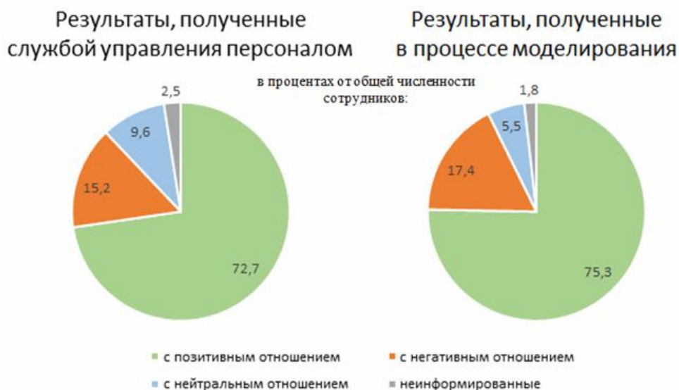
Рисунок 3 – Результаты распространения информации о необходимости строгого соблюдения регламентов по информационной безопасности и возможных последствиях при их игнорировании

Результаты, полученные в процессе моделирования, а также данные непосредственного определения мнения сотрудников специалистами службы управления персоналом через две недели после «информационного вброса», приведены на рис.3.