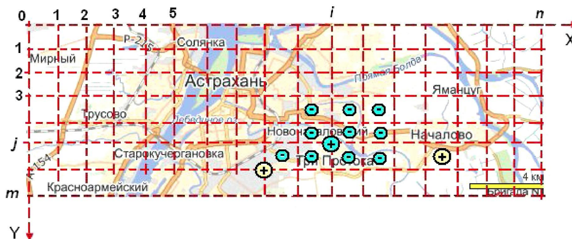
Рис. 1. Схема размещения объектов потребительского спроса и предложения на координатной плоскости карты местности

Получаем для логической связи закон, подобный закону Кулона (1): все торговые объекты будут отталкиваться друг от друга, а к рассматриваемым «точкам» с потенциальными клиентами торговые точки будут притягиваться: